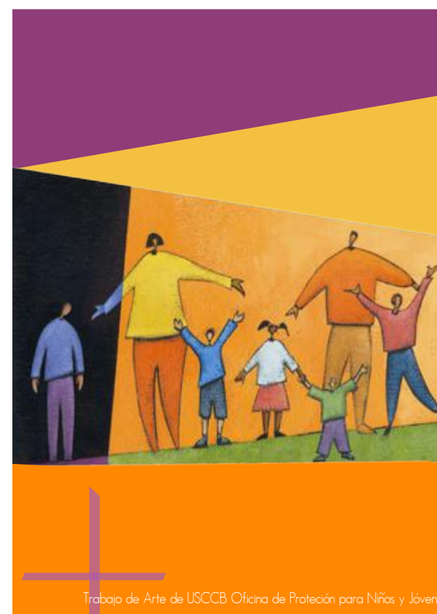
Trabajo de Arte de USCCB Oficina de Protección para Niños y Jóvenes.